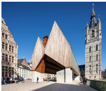
Рис. 3. Павильон Market Hall в Генте (Бельгия) [5] Fig. 3. Market Hall Pavilion in Ghent (Belgium) [5]