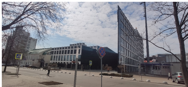
Рис. 7. Бизнес-центр «Servolux» по ул. Миронова в Могилеве (Беларусь)

Целью проекта реставрации традиционного дома в Пекине «Hutong Bubble 218» (Китай, MAD Architects, 2019 г.) (рис. 8) стало оживление старых кварталов города, привлечение людей и ресурсов. Современные архитектурные включения в виде металлических пузырей выполняют функцию общественных пространств. Несмотря на контрастные окружению округлые гладкие формы оболочек и отделку из полированного металла, новые элементы воспринимаются органично благодаря отражению в их зеркальной поверхности традиционной среды.