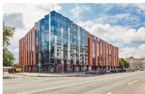
Рис. 6. Бизнес-центр «Kiroff» в Минске (Беларусь) [7] Fig. 6. Kiroff Business Center in Minsk (Belarus) [7]