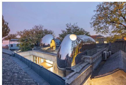
Рис. 8. Hutong Bubble в Пекине (Китай) [9]

Fig. 7. Servolux Business Center on Mironova St. in Mogilev (Belarus)