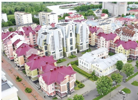
Рис. 1. Студенческий городок в Пинске (Беларусь) [8]

Проекты объединяет идея воссоздания исторического города, при этом архитектурное решение современных объектов может быть обращено как к характерной для данной среды стилистике, так и основываться на использовании нетрадиционных образов, но создающих общую историческую картину застройки. Например, Помпейский дом в Москве (арх. М. Белов, 2001–2005 гг.) воплотил в себе переосмысление античной помпейской живописи и архитектурных форм, расположившись по соседству с памятниками архитектурного наследия модерна и классицизма, органично включаясь в исторический коллаж города.