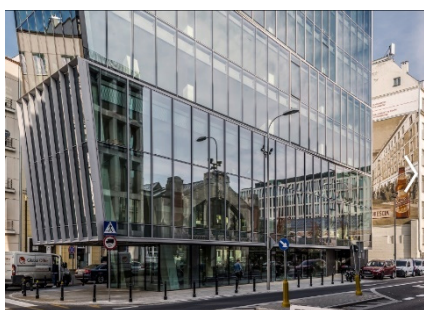
Рис. 5. Офисное здание в Варшаве (Польша) [6] Fig. 5. Office building in Warsaw (Poland) [6]

облик, часто с использованием стекла в отделке фасадов, но при этом гармонично инкорпорировано в контекст города. Например, современное офисное здание в историческом центре Варшавы (Польша, The Nest / Grupa 5 Architekci, 2018 г.) (рис. 5), несмотря на острые прямолинейные аскетичные формы, благодаря сплошному остеклению, отражающему фронт исторической застройки улицы, сливается с городской средой. Эффект отражения исторической среды использован при строительстве торгового центра в Туркуэне (Франция), расположенного возле католической церкви Святого Христофора. Здание с протяженным изгибающимся стеклянным фасадом занимает треугольное пятно бывшего исторического квартала, сохраняя тем самым сложившуюся планировочную структуру города. В архитектурно-художественном решении бизнес-центра «Kiroff» в Минске (Беларусь, арх. В. Дражин, мастерская «Белзарубежстрой», 2015 г.) (рис. 6) связь с контекстом выражена посредством отражения среды в зеркальном остеклении фасадов, а также колористической переключки терракотовых панелей с цветовыми акцентами исторической среды.