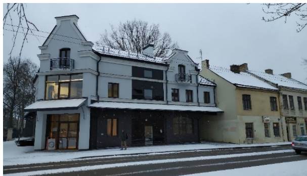
Рис. 2. Здание по ул. Большая Троицкая, 37 в Гродно (Беларусь)

Fig. 1. Student town in Pinsk (Belarus) [8]