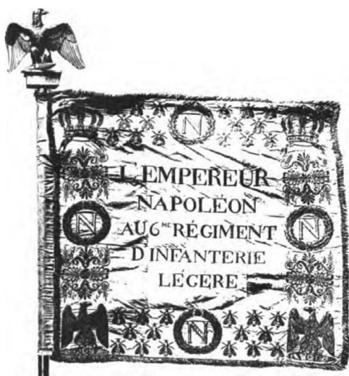
Рис. 5. Орел 6-го полка легкой пехоты модели 1812 г.