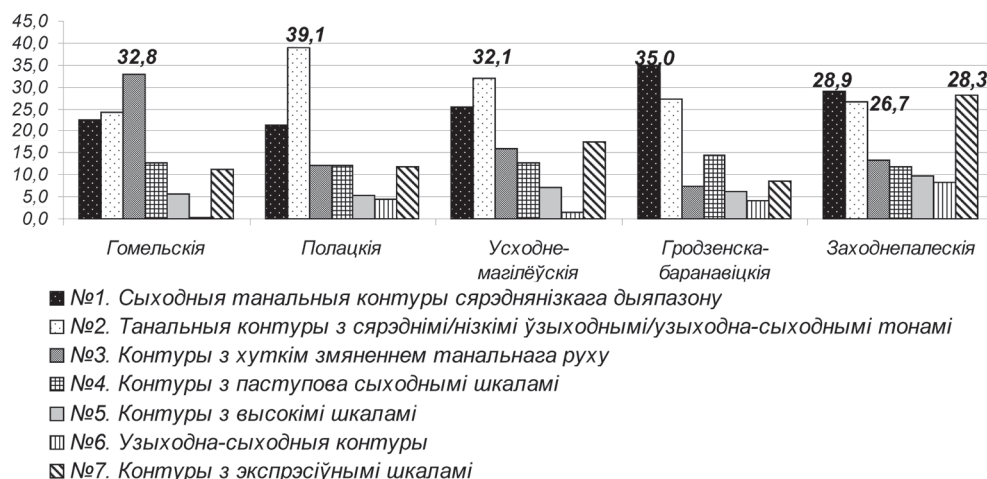
Мал. 1. Размеркаванне найбольш тыповых танальных кантураў у маўленні прадстаўнікоў розных груп беларускіх гаворак (працэнтныя долі кантураў тыпаў 1–6 складаюць у суме 100%; колькасныя суадносіны кантураў тыпу 7 вызначаліся асобна ад змешчаных пад лічбамі 1–6 у долях ад 100%. Класіфікацыя танальных кантураў менавіта на такія тыпы і іх падлік па адзначанай метадыцы былі прадэктыраваны спецыфікай маўлення ўдзельнікаў эксперымента)

Асноўным прасадыхным маркерам гродзенска-баранавіцкіх і заходнепалескіх гаворак з'яўляецца дамінуючае выкарыстанне сыходных меладычных узораў №1 (35,0 і 28,9% суадносна), утвораных сярэднімі/нізкімі ядзернымі сыходнымі тонамі і сярэдняй/нізкай шкалай або без шкалы. Дадзеныя контуры пераважаюць у фінальных інтанацыйных групах і ствараюць тым самым эффект меладычнасці маўлення жыхароў Паўднёва-Заходняй Беларусі. У дапаўненне аўды-