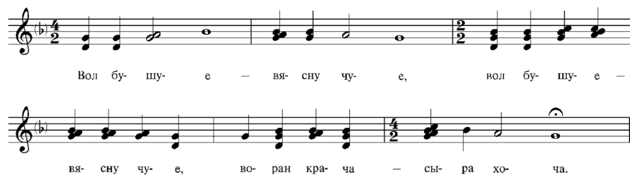
Мал. 3. Инварыянт песні “Вол бушуе – вясну чуе” Fig. 3. Song invariant “Vol bushye – viasnu chuye”

Вар’іраванне меладычнай рытмікі адбываецца за кошт разнастайных распеваў (апяванняў, злучэнняў, замаху, падаўжэння аднаго гука, што таксама натуецца і ферматай). Утварэнне варыянтаў напеву праходзіць у межах тэтрахорда мажорнага ці мінорнага нахілення з субквартай. Хуткасць руху песень неаднолькавая – ад спакойнага да ўмеранага тэмпу – і залежыць ад эмацыянальнага тону, стылю і дыялектных спеўных традыцый.