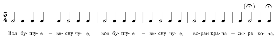
Мал. 6. Рытмаформула песні “Вол бушуе – вясну чуе” з в. Каляніца Мінскай вобласці Fig. 6. Rhythmic song formula “Vol bushye – viasnu chuye” from the village Kalianitsa Minsk region

Такім чынам, у выніку даследавання былі выяўлены факты існавання варыянтнага мноства беларускіх народных веснавых песень “Вол бушуе – вясну чуе”, адрозненні мясцовых стыляў і традыцый, выяўлены шэраг прычын, што ўздзейнічаюць на ўзнікненне песенных варыянтаў (месца,