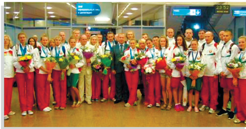
Белорусские спортсмены в Национальном аэропорту после возвращения из Дефлимпийских игр (2013 г.) Belarusian athletes at the National Airport after returning from the Deaflympics (2013)

в которых был отражен опыт обучения студентов Белорусского государственного педагогического университета имени М. Танка и проведения эксперимента по апробации и внедрению жестового языка в специальном образовании Республики Беларусь, вызвали интерес у российских специалистов и представителей некоторых республик бывшего Советского Союза, где преподавание национального жестового языка как предмета отсутствовало [11, с. 14; 23].