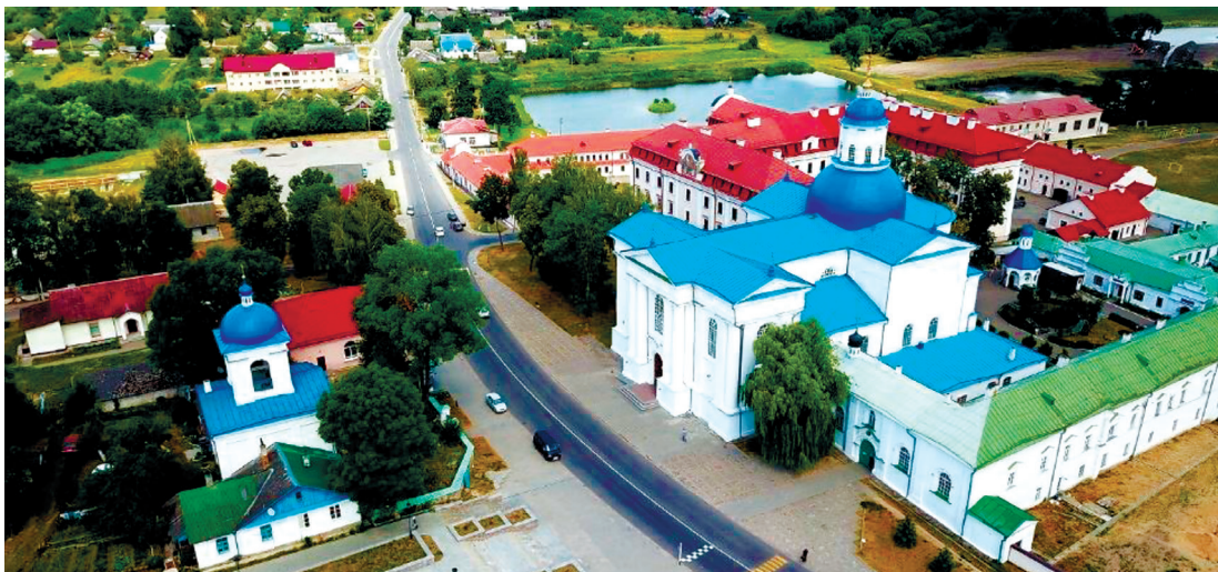
Рис. 2. Свято-Успенский Жировичский мужской монастырь