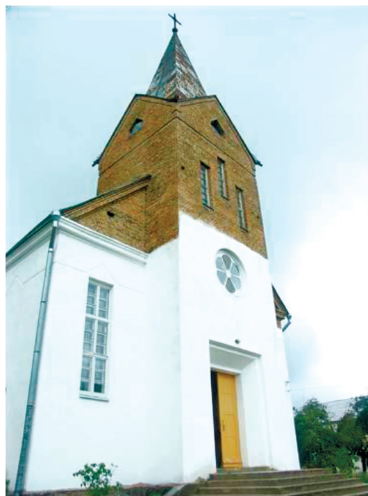
Рис. 3. Костёл Пресвятой Девы Марии, д. Альбертин (Гродзенская обл., Слонимский район, Беларусь)