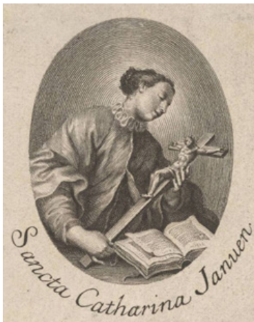
Мал. 6. Св. Кацярына з распяццем у руках (Carlo Gregori (1702–1759), пасля 1737 г. (Die Staatlichen Kunstsammlungen Dresden (Kupferstich-Kabinett)))