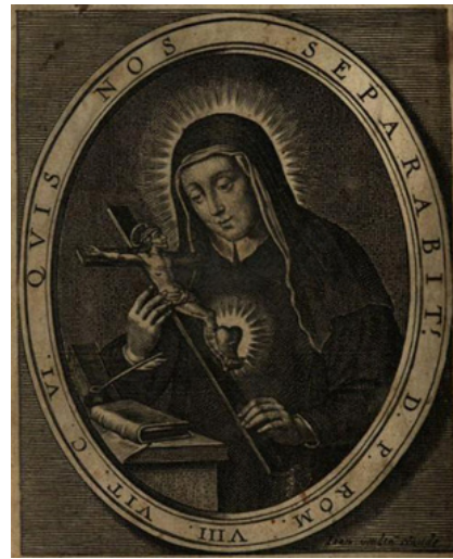
Мал. 5. Св. Кацярына з распяццем у руках (Davide Campi, 1742 (Museo dei Beni Culturali dei Cappuccini))