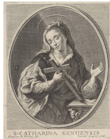
Мал. 7. Св. Кацярына з распяццем у руках (Carlo Gregori (1702–1759), пасля 1737 г. (Die Staatlichen Kunstsammlungen Dresden (Kupferstich-Kabinett)))