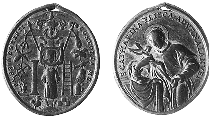
Мал. 2. Рымска-каталіцкі абразок XVIII ст. з курганнага могільніка Глыбаў Рэчыцкага раёна Гомельскай вобласці

Іканаграфія. На ліцавым баку абразка размешчаны рэльефныя выявы прылад пакут Ісуса Хрыста. Прылады пакут, згодна з афіцыйнымі Евангеллямі ад Матфея, Марка, Лукі, Іаана, а таксама апакрыфічнымі тэкстамі, сімвалізуюць падзеі, якія прынеслі Хрысту фізічныя і духоўныя пакуты і адбываліся ў Іерусаліме ў апошнія дні і гадзіны яго зямнога жыцця, а таксама пасля смерці [3]. Агульная колькасць элементаў-сімвалаў, адлюстраваных на ліцавым баку абразка, складае 27. Інтэрпрэтацыя размешчаных сімвалаў ажыццяўлялася з дапамогай Евангельскіх тэкстаў, твораў іканапісу і дэкаратыўна-прыкладнога мастацтва (мал. 3).