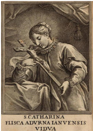
Мал. 4. Св. Кацярына з распяццем у руках з кнігі «Vita Di Santa Caterina Fiesca Adorna Da Genova», 1737 г.