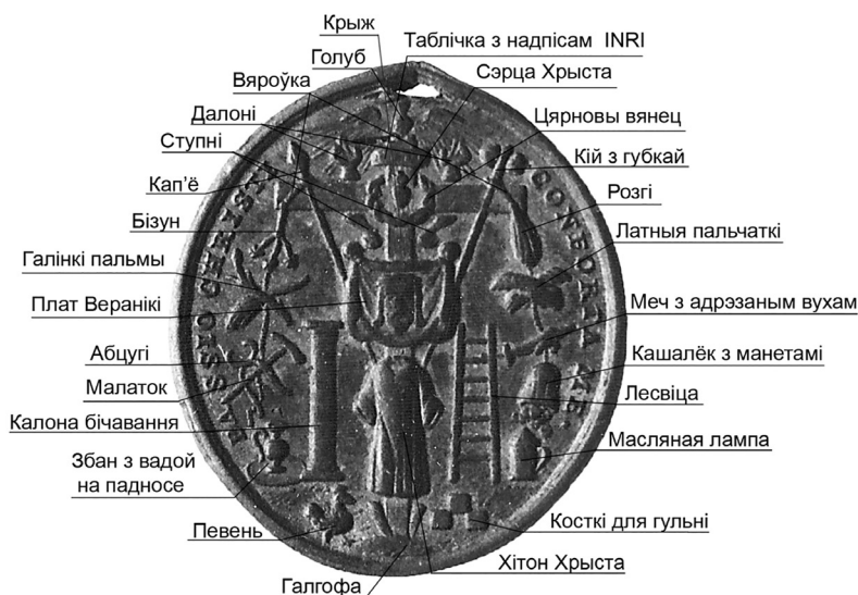
Мал. 3. Схема размяшчэння прылад пакут Хрыста на рымска-каталіцкім абразку XVIII ст. з курганнага могільніка Глыбаў Рэчыцкага раёна Гомельскай вобласці