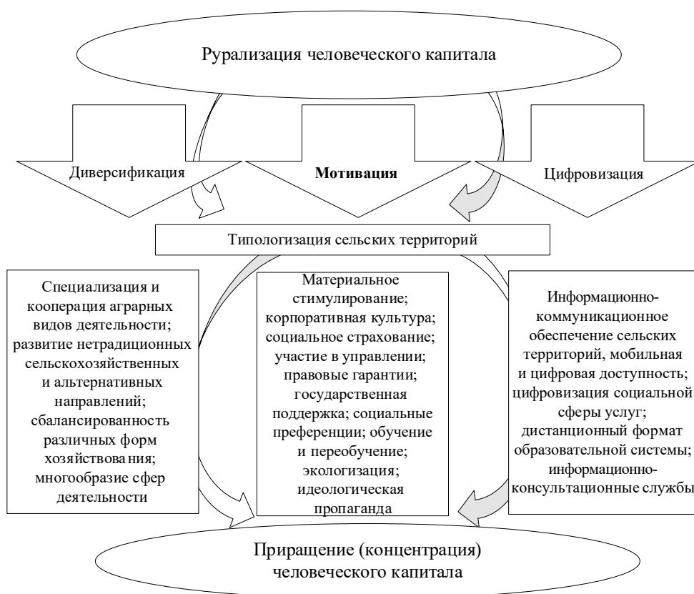
Рис. 1. Концептуальная модель рурализации человеческого капитала

Важным элементом концепции рурализации человеческого капитала выступает сохранение благоприятной экологической обстановки в сельской местности. Соответственно, расходы на ее