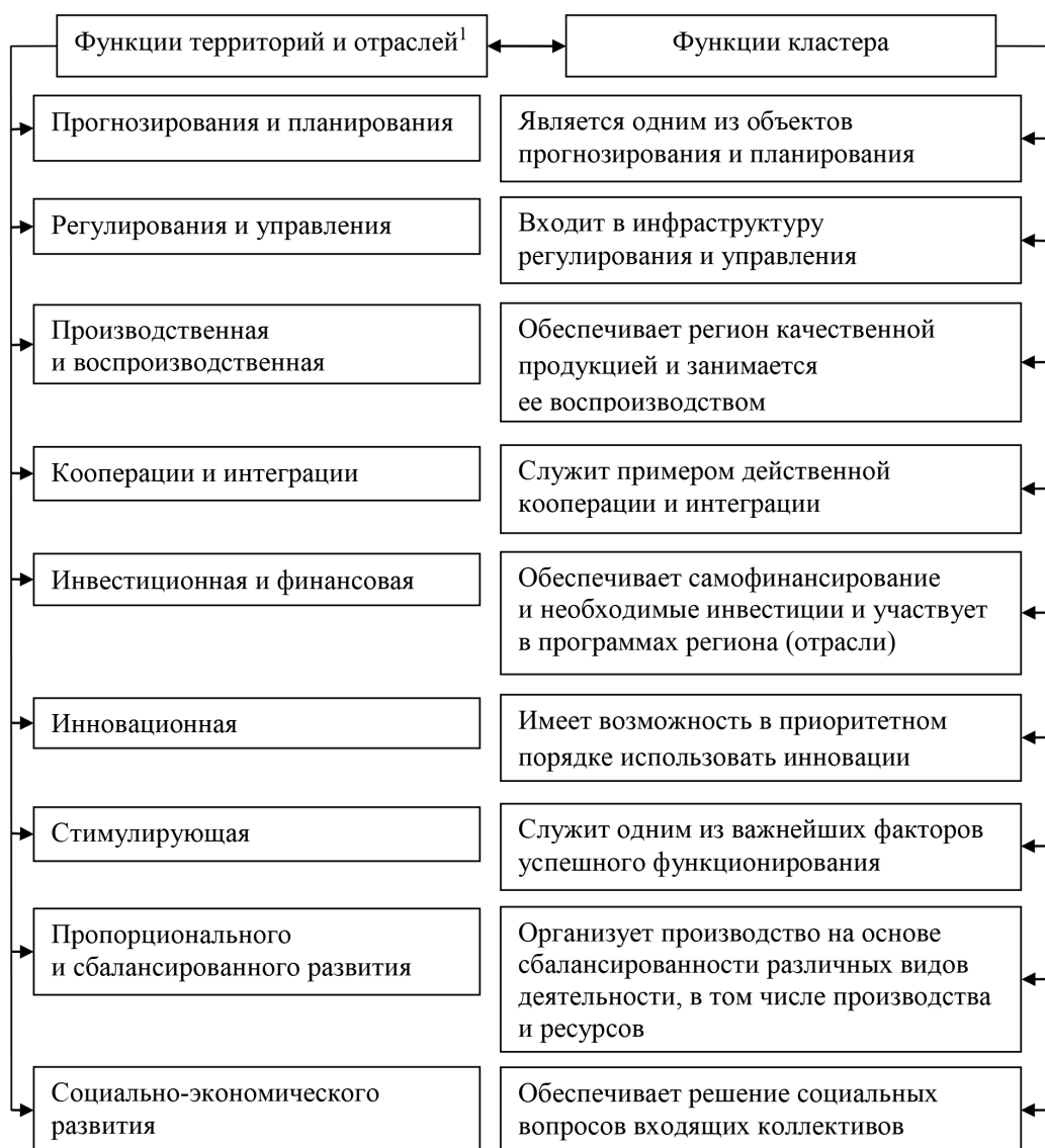
Рис. 2. Взаимосвязь функций региональной (отраслевой) экономики и кластерных организаций