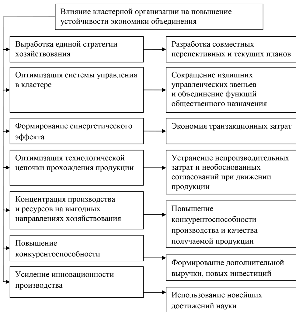
Рис. 1. Основные направления влияния кластерной организации на результаты деятельности входящих структур