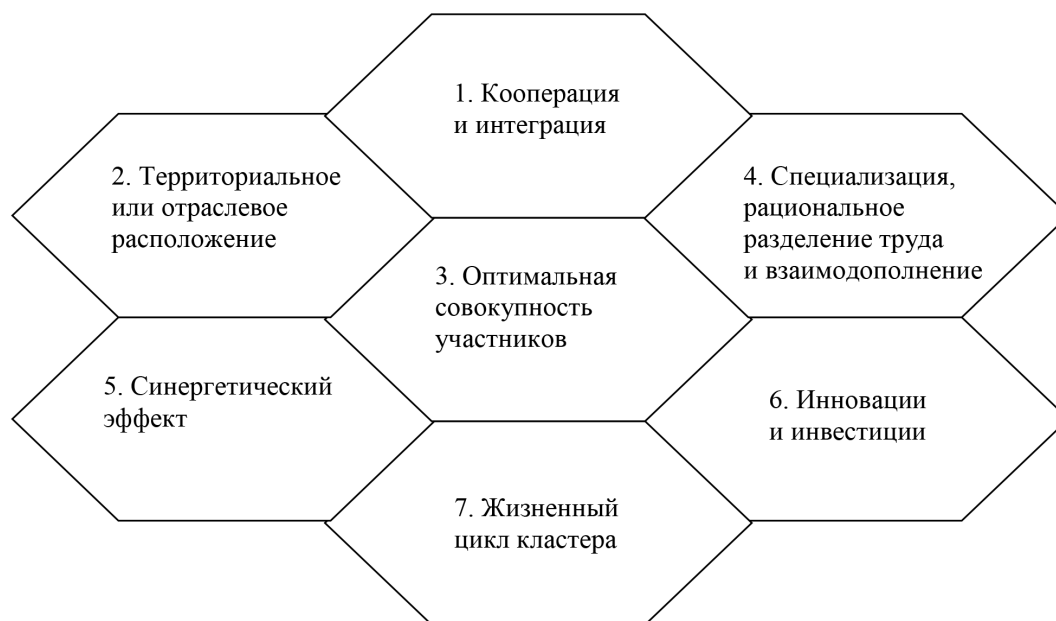
Рис. 3. Важнейшие характеристики кластера Fig. 3. The most important cluster characteristics

Четвертой основной характеристикой кластеров должна быть, по данным выполненного нами исследования, специализация. Участники кластера взаимосвязываются между собой через какой-то основной вид деятельности (например, молочный кластер, кластер по производству мясной продукции и пр.). Нередко кластерная организация выходит за рамки одной отрасли и охватывает смежные направления, в этой связи процесс кластеризации сочетается с диверсификацией. Однако чем четче проявляется специализация, которая сопровождается концентрацией производства, ресурсов, инвестиций и инноваций, тем нагляднее смысл кластеризации и значительнее совокупный эффект.