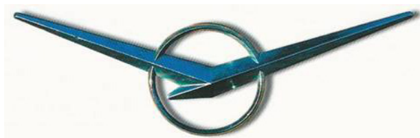
Рис. 3. Эмблема Ульяновского завода, разработанная А. Ф. Ковалёвым, 1961 г.